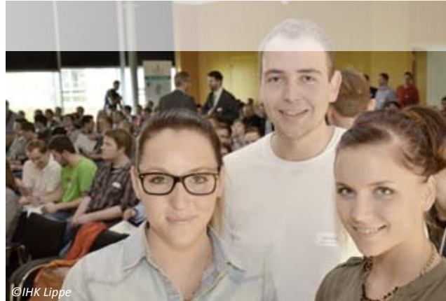
Energie-Scouts der Mittelstandsinitiative Energiewende und Klimaschutz.

Energieeffizienz und Klimaschutz in Unternehmen spielen für den Erfolg der Energiewende eine entscheidende Rolle – auch als Schlüssel für die Wettbewerbsfähigkeit kleiner und mittelständischer Unternehmen.